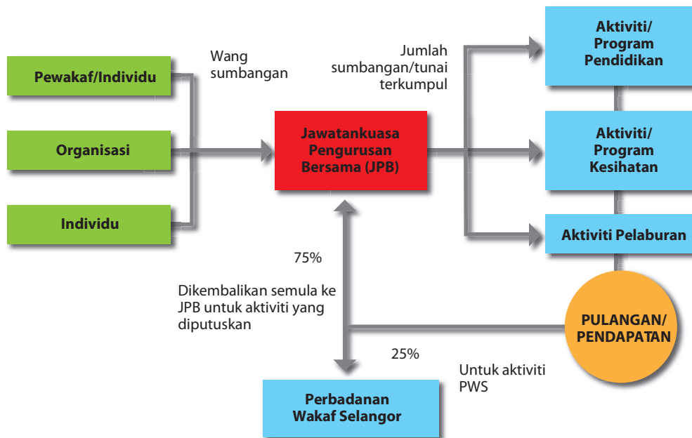
Gambarajah 1: Cadangan Carta Aliran Pengurusan Dana Wakaf